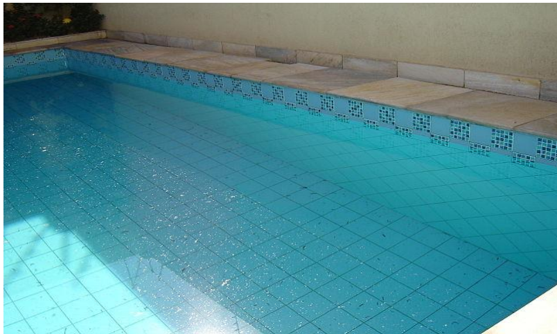
Figura 1: Uma piscina com fundo plano parece ter profundidade variável devido ao fenômeno da refração da luz.

Assim como o entendimento dos espelhos está diretamente ligado ao fenômeno da reflexão da luz, a compreensão do fenômeno da refração da luz é condição imprescindível para o estudo dos instrumentos óticos conhecidos como lentes delgadas , que abordaremos mais adiante. Além disso, a refração da luz está por trás de muitos fenômenos interessantes, como, por exemplo, a decomposição da luz branca por um prisma , a formação do arco-íris e o fato de que uma piscina cheia aparenta ser mais rasa do que realmente é, como ilustra a figura 1.