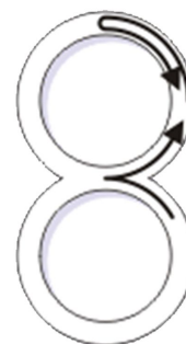
Percursos não permitidos